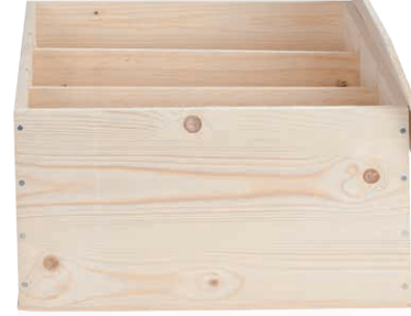
5 Holzkiste Holzkiste für 6 Flaschen Art.-Nr.: D 99820 6er