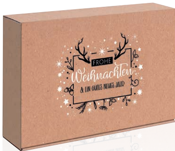
6 Frohe Weihnachten natur Geschenkkarton Art.-Nr.: D 99984 2er Art.-Nr.: D 99985 3er