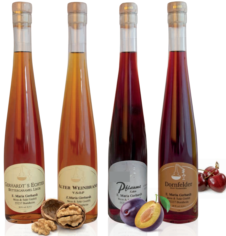
10 Gerhardt's Echter (0,35 Liter) Art.-Nr.: B 2920 Likörspezialität mit Butter und Karamell. Rein natürliche Zutaten, frei von jeglichen Farb- und Konservierungsstoffen. Pur oder eisgekühlt genießen. Auch für Cappuccino, Kaffee oder süße Desserts.