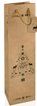
4 Merry Christmas Geschenktüte für 1 Flasche Art.-Nr.: D 99983