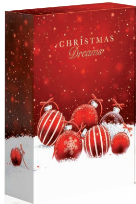
7 Weihnachtstraum Geschenkkarton Art.-Nr.: D 99986 2er Art.-Nr.: D 99987 3er