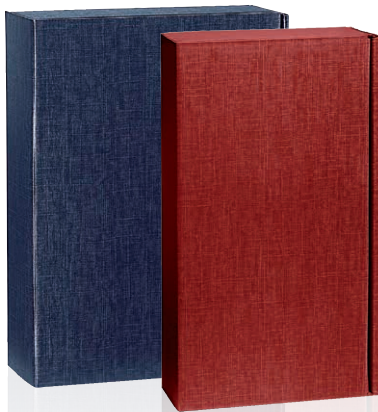
1 Leinenstrukturkarton Geschenkkarton Art.-Nr.: D 99807 2er bordeaux Art.-Nr.: D 99813 3er bordeaux Art.-Nr.: D 99808 2er blau Art.-Nr.: D 99814 3er blau