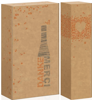
8 Danke Geschenkkarton Art.-Nr.: D 99991 1er Art.-Nr.: D 99994 2er